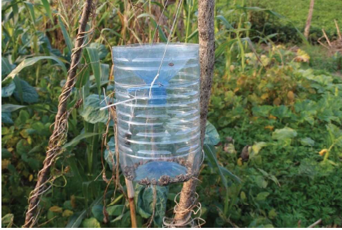
Damacana veya plastik şişe tuzak