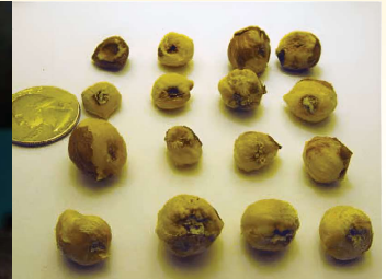
Fındıktaki zarar