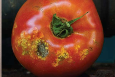
Domatesteki zarar