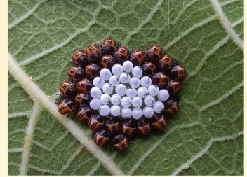
Yumurtalar ve nimfler

Sokucu emici ağız yapısına sahip olan kokarca böceklerinin beslendikleri meyvelerde ilk olarak küçük nekrotik alanlar oluşur. Asıl zararları ise meyvelerin olgunlaşma sürecinde ortaya çıkar.